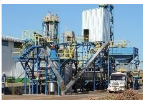
Estrutura para carregamento de caminhões