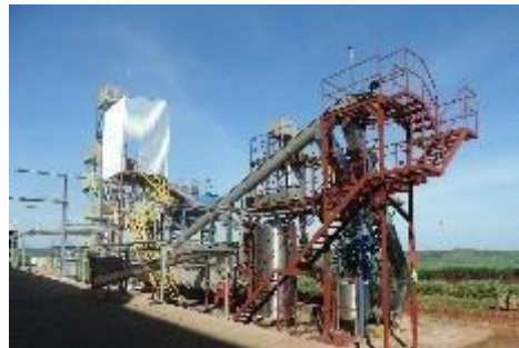
Montagem de D' Lemonene