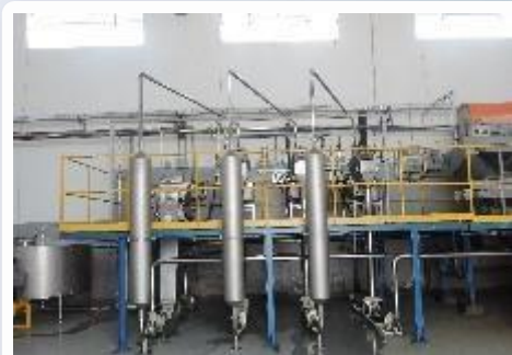
Tubulação sanitária inox