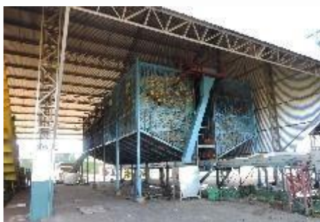
Silo para armazenagem de laranja