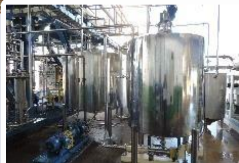
Blender com agitador para armazenagem